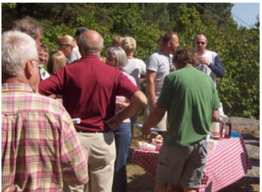
Välkomna till årsmötet den 8:e juli. Efter mötet "mingel-fika" vi som vanligt. Bilden ovan visar förra årets minglande och fikande.