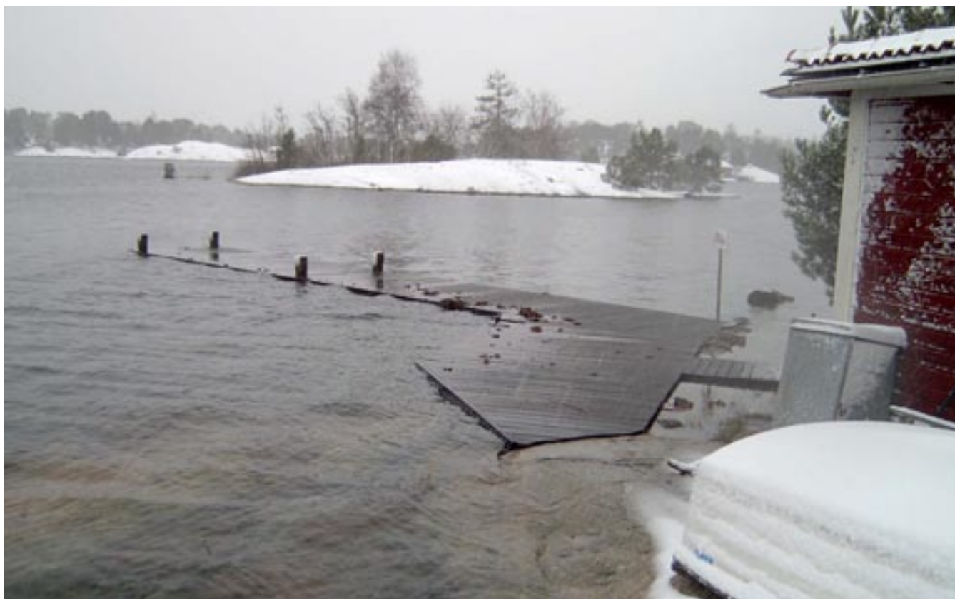
Bilderna är tagna i vintras när vattnet steg, och steg och steg ända tills det nådde över bryggorna.

N ågot som många, som bara njuter av vår vackra ö sommartid, aldrig kan föreställa sig, är verkningarna av högvattnet. Otaliga är gångerna när vi möts av skrattsalvor då vi binder fast en båt som vi dragit upp kanske 3 meter på land.