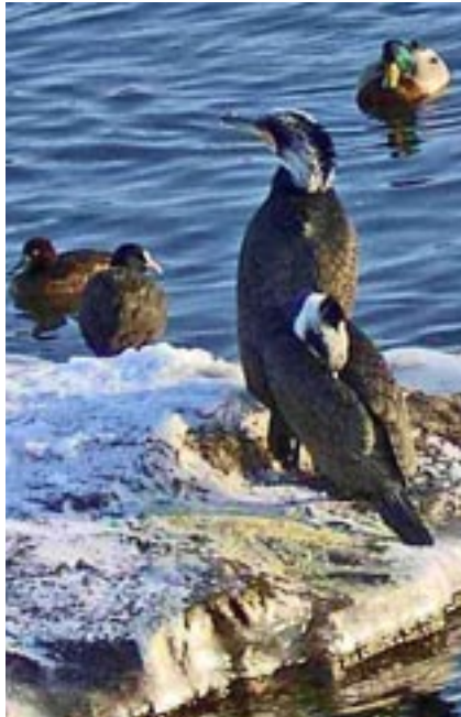
Storskarv i Stockholms ström.

6. Plantera flera olika arter av blommor, buskar och träd. Plantera