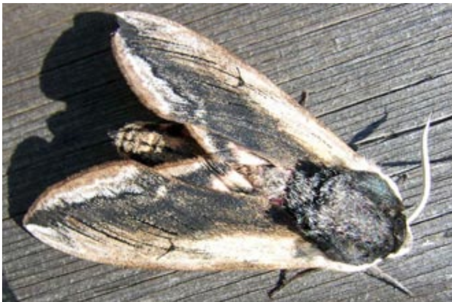
Ligustersvärmare på trappträcke i Harö by.

T änk dig en liten skärgårdsö 50 meter lång och 20 meter bred. På ön finns för skärgården typisk martallskog, och på en sån här halvstor ö nästan enbart sådan. Men på ön finns några enstaka lövträd i en liten sänka. Detta lilla lövparti utgör en s.k. mikrobiotop i den annars ensidiga martallskogen.