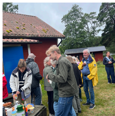
Mingel utanför skolan