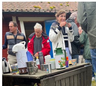
Uppdukad fika vid årsmötet