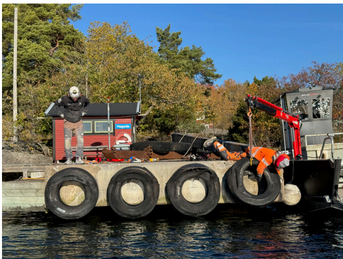
Arbete i full gång i Hagede.

Douglas och David från BGT (betonggolv teknik) hjälpte oss under oktober månad med att fräscha upp betongkanterna på Harö och Hagede brygga. Armeringen, som kommit i dagen, behandlades med korrosionsskydd och göts över. Ringar till upphängningen av fenderbalkarna byttes ut och även själva däcken på Hagede brygga byttes ut. Det visade sig att däcken till fenderbalken vid sidan av Hagede brygga var annorlunda monterade än övriga och vi kommer därför att behöva justera dem igen.