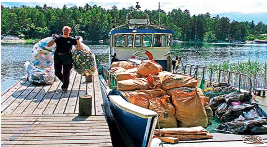
Sophämtning vid brygga

Vår sophantering kommer att påverkas av ändringar i Förpackningsförordningen och Avfallsförordningen framöver.