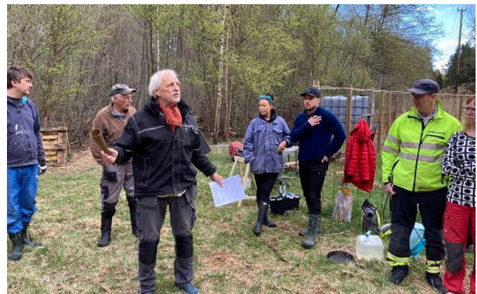
På Öbor i Facebook finns många fler bilder från arbetsdagen.