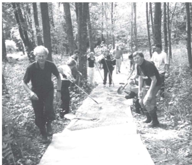
Lördagen den 21 augusti 1999 började för Hasselöborna med "det stora vägarbetet" och avslutades med "den stora festen".

Till höger ser vi ett uppslag från Harö-Nytt nr7 år 2000. Även förr har vi behövt ta strid för trafiken ut till våra öar. Ur denna och många andra strider har vi gått segrande. Vi får hoppas att vi åter får gehör för de välbehövliga båtlinjerna ut till Harö, Hagede och Hasselö.