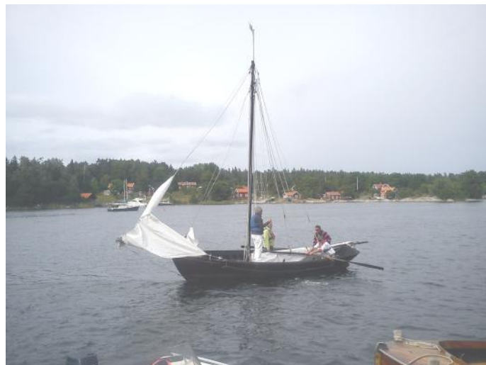
Garanterat svallfri framfart

Teknikfakta: När en båt körs riktigt sakta har trimningsvinkel på utombordaren eller drevet inte så stor betydelse, men så snart vi ökar farten eller när båten planar, så är trimningsvinkeln på båten betydelsefull både vad det gäller båtens svall och bränsleekonomin.