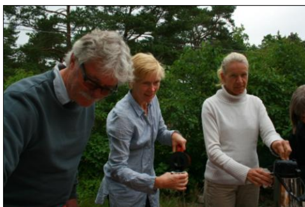
Affären bjöd som vanligt på kaffe efter årsmötet i Harö skola.