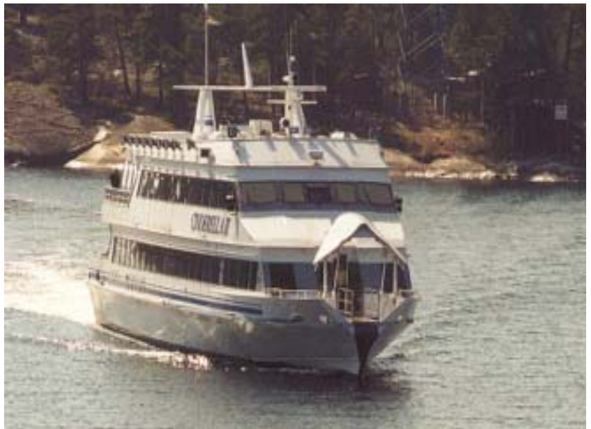
Cinderella II på väg in till Hagede brygga lördagen den 28 april.

Harö-Hasselö Intresseförenings aktion med skrivelser till lands- hövdingen och Waxholmsbo- lagets VD samt uppvaktningar gav resultat - i år har vi fått tillbaka direktbåtarna från Stockholm till Harö-Hagede!