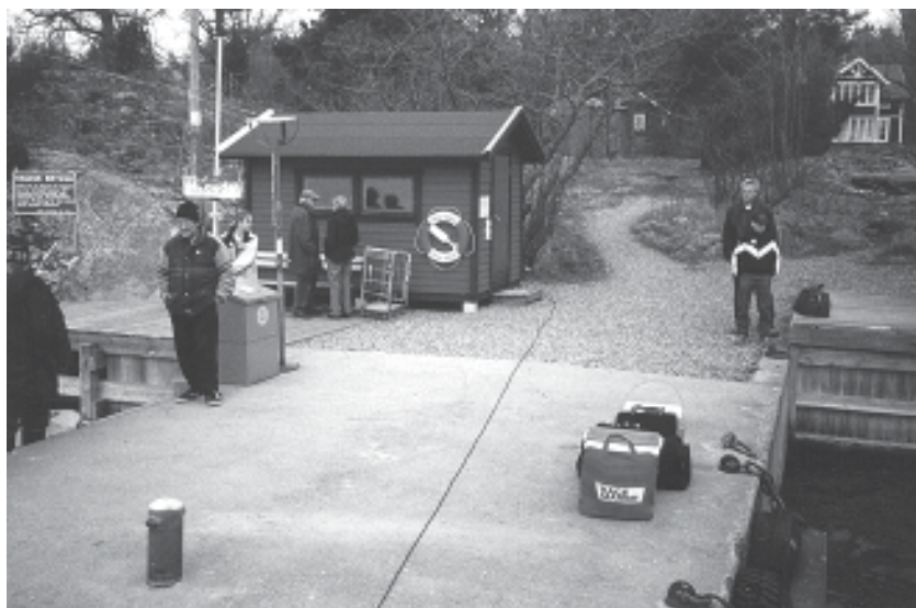
HAGEDE BRYGGA byggdes 1975 sedan den gamla bryggan demolerats av s/s Vaxholm. Bryggan klövs då i två delar!

brygga måste starta på nytt att förhandla med Vägverket som projekterade och upphandlade en ny Hagede-