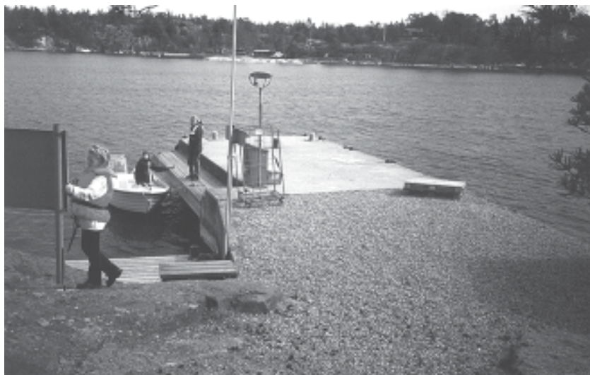
HARÖ BRYGGA byggdes 1973 sedan den gamla rasat. Den ponton som användes som reservbrygga sjönk en vacker höstdag 1974.