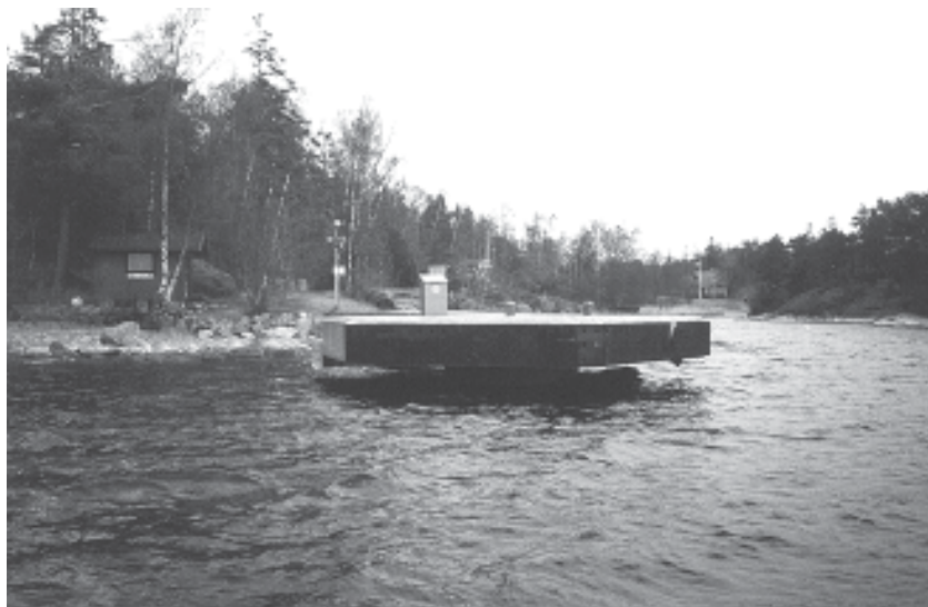
HASSELÖ BRYGGA byggdes 1985. Den byggdes på några veckor enligt en ny metod och med hjälp av jättekranen Lodbrok.

Då blev det bråttom. Föreningen, som just skrapat ihop pengar till Harö